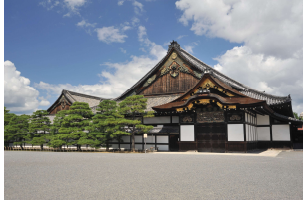
二の丸御殿【国宝】 東南から北西にかけて、遠侍、式台、大広間、蘇鉄の間、黒書院、白書院の6棟が雁行形に立ち並ぶ御殿です。将軍の威厳を示す虎や豹、桜や四季折々の花を描いた狩野派の障壁画(模写画)で装飾されています。