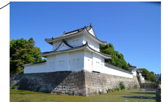
東南隅櫓【重要文化財】 二条城の外堀の四隅は、見張り台としての隅櫓が建てられ、普段は武器庫として使われていました。