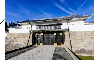
東大手門【重要文化財】 二条城の正門にあたり、現存の門は1662年(寛文2年)頃の建築と考えられています。