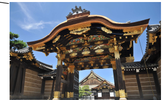
唐門【重要文化財】 二の丸御殿の正門にあたり、切妻造、檜皮葺の四脚門でその屋根の前後に唐破風が付きます。門には長寿を意味する「松竹梅に鶴」や、聖域を守護する「唐獅子」など、豪華絢爛な極彩色の彫刻を飾ります。