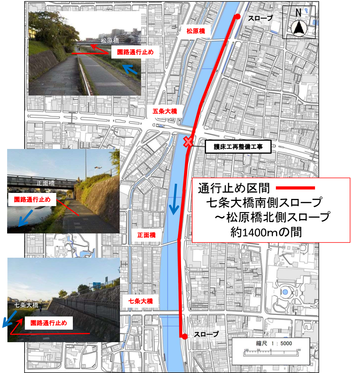
護床工再整備工事箇所